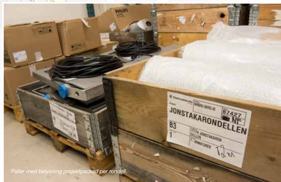
Pallar med belysning projektpackad per rondell.

Varberg Energi skrev därefter en specifikation med det antal armaturer som krävs för varje rondell och skickade över till Elektroskandia. >>